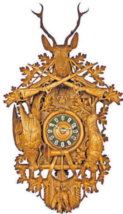
Traditionell: Kuckucksuhr mit Jagdmotiven

Schwarzwald-Reisende sind Naturliebhaber. Oft, ja. Aber auch Kunst- und Kulturfreunde kommen in der Ferienregion durchaus auf ihre Kosten.