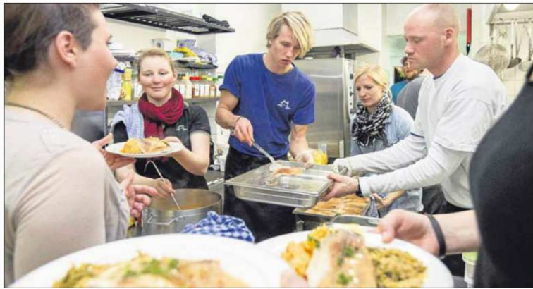
Im Frosch Sportclub Derby in Davos findet Ende November das nächste Seminar für Hobbyköche statt.

Die Maschinenhalle der Zeche Zollern mit ihrem Jugendstilportal ist nach neun Jahren Restaurierung wieder für Besucher zugänglich. Zu den Höhepunkten gehören neben dem Portal die große Schichtfalle aus Marmor und eine elektrische Fördermaschine von 1902, die bald wieder in Betrieb gesehen soll.