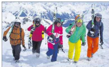
Arbeiten, wo andere Urlaub machen, zum Beispiel eben in Davos.

Frosch Sportreisen begegnet dem Fachkräftemangel und macht Laien zu Köchen für bis zu 100 Gäste. In einem speziellen Seminar im Schweizer Davos macht der Münsteraner Reiseveranstalter ambitionierte Hobby-Köchinnen und -Köche fit für den Küchenalltag in seinen Frosch Sportclubs. „Es wird Jahr für Jahr schwieriger, fähige Köche für den langfristigen Einsatz in unseren Hotels im europäischen Ausland zu finden.“